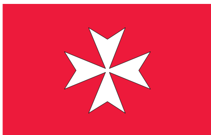
CRUZ DA ORDEM DE MALTA

REPRESENTA O PASSADO HISTÓRICO DA FREGUESIA QUE FOI PERTENÇA DA ORDEM DE MALTA (OU ORDEM DO HOSPITAL).