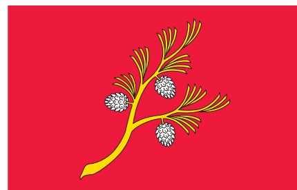
RAMO DE PINHEIRO

REPRESENTAM A LAGOA ARTIFICIAL, O RIO ZÊ ZERE E OS CURSO DE ÁGUA QUE PASSAM NA FREGUESIA E QUE ALÉM DE FORNECEREM A FORÇA MOTRIZ PARA OS MOINHOS DE ÁGUA, SÃO TAMBÉM LOCAIS DE LAZER E DE PESCA.